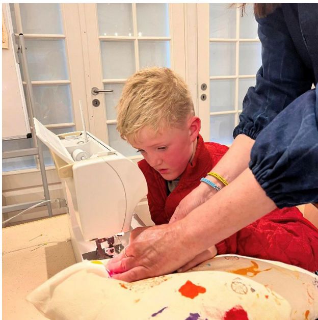
Dybkoncentration mens der bliver guidet i at sy puden sammen