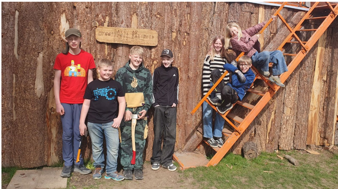
Valgholdselever fra hyggebygge- og akvarievalgholdet poserer foran den træbeklædte container. Der er utrolig mange fine billeder fra valgholdene på vores facebook side som I kan gå på opdagelse i.

på deres nye hold og ser lokalerne og hilser på deres kommende holdkammerater. Planerne for dagen vil fremgå på holdenes ugeplaner.