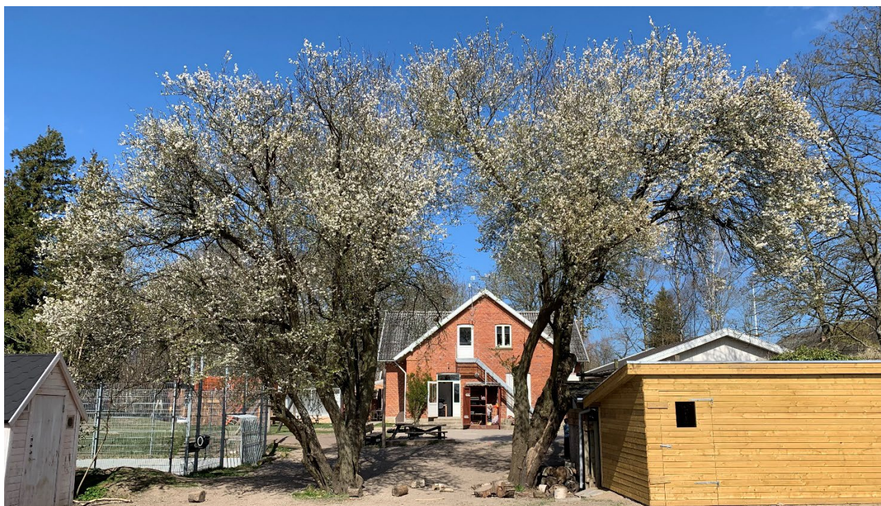
Træerne blomstrer fint med hvide blomster

Kære alle elever, forældre og ansatte på Gribskov Lilleskole, hermed skoleårets tredje skolenyt. Lyset og varmen er ved, at komme tilbage, og det mærkes på aktiviteten og humøret. Det første liv er begyndt, at komme op af jorden og man kan se de første blomster og blade på træerne komme frem. Det vidner om den dejlige tid vi går i møde.