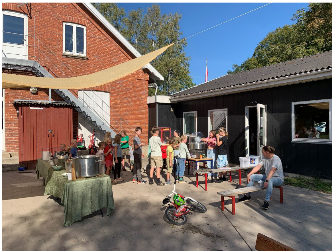
Efter frokost var der på til popcorn og candyfloss ved sidste hyggebyggedag