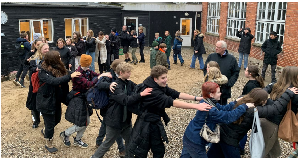
Elever og ansatte i kædedans rundt om skolen