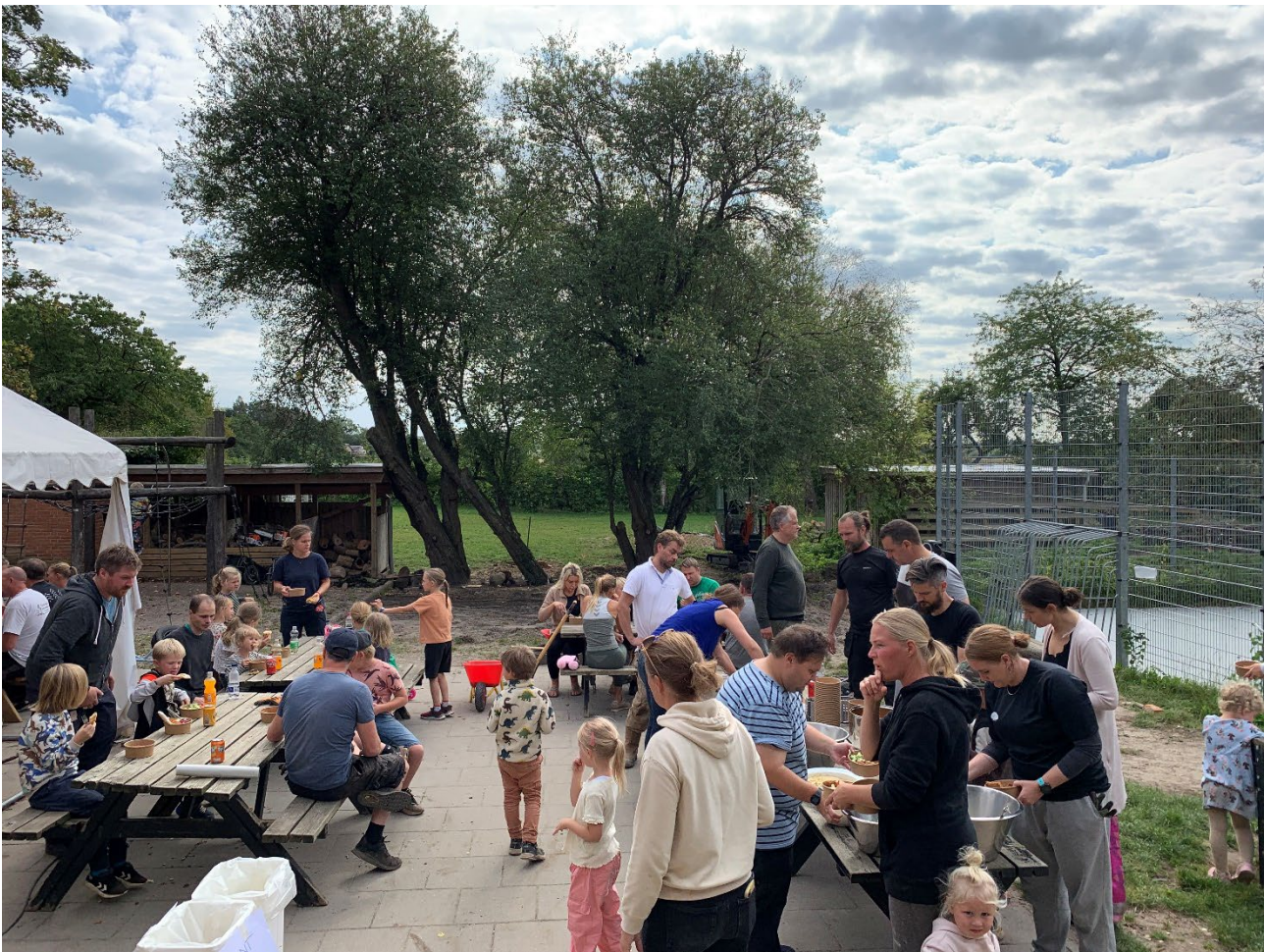
Frokostpause til Hyggebyggedag i september 2023

Der vil selvfølgelig være forplejning, godt humør og gode muligheder for at få en uformel snak med bestyrelsen, ledelsen og andre af skolens forældre.