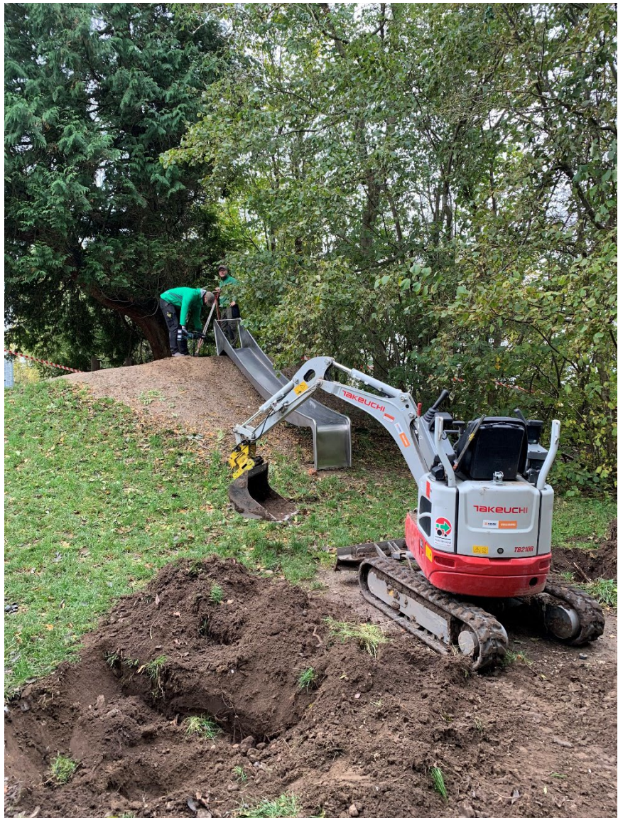
Der bliver monteret rutsjebane

Vi har mange flere ønsker til vores udeområder, vi arbejder for at få realiseret over de kommende år, men dette bliver første spadestik i det projekt.