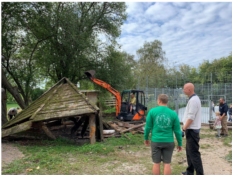
Den gamle bålhytte var mæt af dage og måtte lade livet.

Skoleårets første hyggebygge dag, havde et rigtig flot fremmøde, og der var mange maskiner i gang på grunden. Ud over den generelle oprydning, bortskaffelse af affald og fjerne ukrudt, samt vinduespudsning fik vi også klaret et par andre opgaver: udvidelse af parkeringspladsen, lagt strøm i udekøkkenet og behandlet træværket samt sat tagrender på, udvidet køkkenhaven og anlagt kompostbunke, fjernet bålhytten, rensede tag og tagrender, afmonteret "corona-vaskestationerne", oprettet fliselunker, malet lister, fældet træer og skåret op til brænde og meget mere.