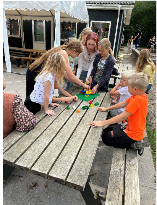
Eleverne skal genskabe en LEGO-konstruktion