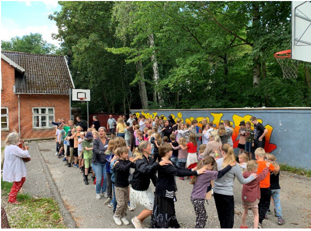
Opvarmning til teambuilding dag

Traditionen tro holdt vi teambuilding dag i starten af skoleåret for at lade eleverne møde hinanden på tværs af holdene. Det var som altid en hyggelig dag, hvor eleverne fik mulighed for at vise deres samarbejdsevner og ikke mindst kvaliteter for omsorg for hinanden. Der var således både præmier for både samarbejdsevner og til de grupper der i særlig grad udviste omsorg for hinanden.