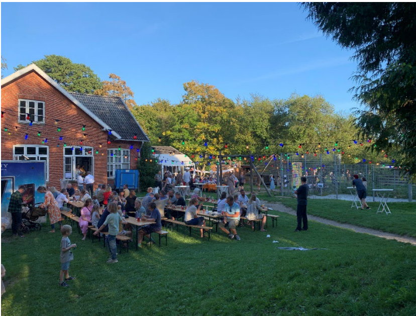
Eleverne har gjort klar til årets sensommerfest