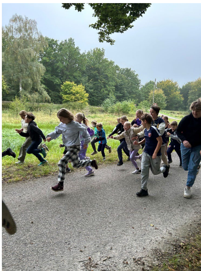
Startskuddet er gået