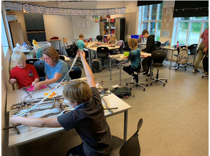
Krea-holdet havde gang i forskellige projekter: vævning på deres egen væv og rivebilleder af æbler og pærer.