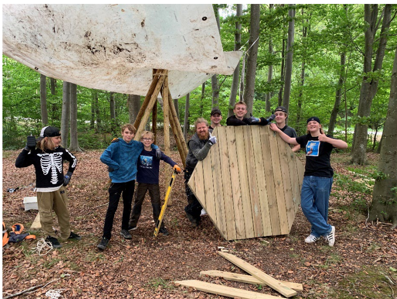
Udebyg var ved at sætte et overdække op til deres udearbejdsrum, og viste stolt fundamentet til deres tipi frem.